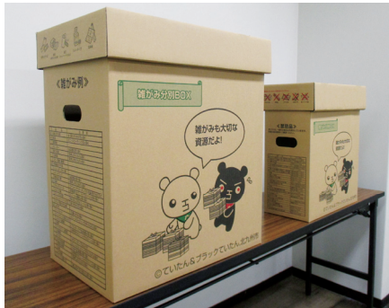
雑がみ分別BOX (段ボール素材90L・45L)

そこで環境局では、適正処理と資源化・減量化の啓発のため、『雑がみ分別BOX』を事業所向けに無料配布いたしますので、ご利用ください。