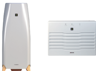
【空気消臭除菌装置】