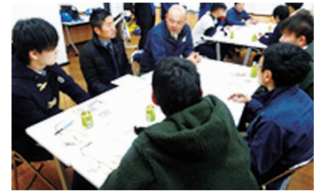
インターンシップの様子(イメージ)

詳細は、ホームページをご覧ください。URL: https://www.kyutech.ac.jp/yukyuintern-offer/