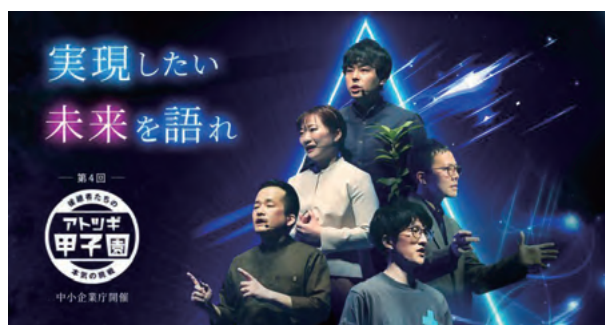
出展:アツギ甲子園