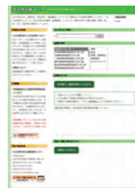
北九州技術マップ (web版) https://b2b.ktc.ksrp.or.jp/