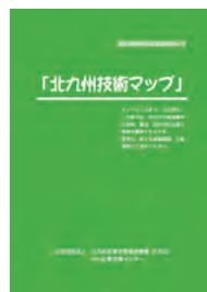
北九州技術マップ (冊子版)

【問い合わせ先】公益財団法人北九州産業学術推進機構中小企業支援センター TEL:093-873-1430