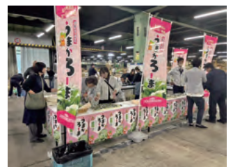
販促イベントの様子

今回のブランド化の活動で、周知・価格アップを実現することができ、また、出荷組合の一体感が生まれるとともに、組合員のモチベーションも上がっているとのことです。(JA担当者談)