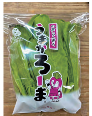
うまかろーまパッケージ

大葉春菊は、葉に「きざみ」のある小葉春菊や中葉春菊と比べて葉が幅広く丸みがあり、また味は「えぐみ」がなく生でも美味しく食べられることが特徴です。若者や子供に美味しく食べてもらえるようなレシピを生産者の奥様方を中心に考えていただき、試食会をおこなうなどしたのち冊子にまとめていただきました。このレシピはパッケージに印刷されたQRコードからも見ることができます。