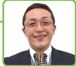
スマイリーキクチ 氏