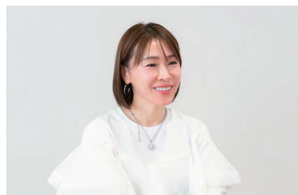
株式会社ARIGATO 代表取締役